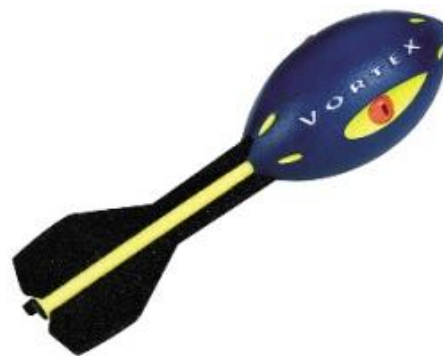
Ein Nerf Vortex

Granaten: Schaden hängt vom Typ der Granate ab. Gasgranaten betäuben, Splittergranaten töten (ein sehr philosophischer Satz... Naja!). Energiegranaten wie z.B. Thermaldetonatoren desintegrieren. EMP-Granaten machen keinen Schaden, sondern sie stören jegliche Form von Elektronik, d.h. Computer, Tricorder, Energiewaffen. Diese müssen dann erst repariert werden.